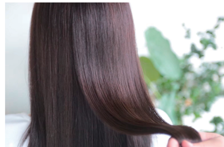
intensive care treatment & mist使用

傷んだ髪から艶美人へ。髪の蘇り、艶やかさへの変化。ヘアケアすることで髪の美しさを取り戻し、指先で感じる滑らかさと自信を手に入れる。艶美人への未来を切り開きましょう。