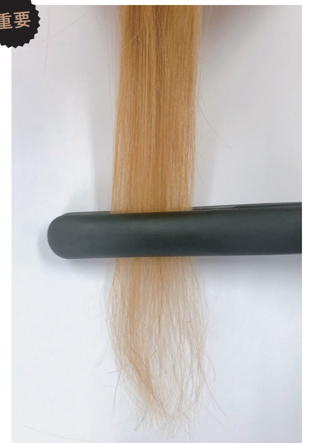
アイロンで仕上げます。