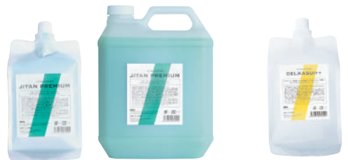
《 1st ジタンプレミアム 》 1000ml / 4000ml