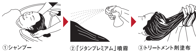
①シャンプー ②「ジタンプレミアム」噴霧 ③トリートメント剤塗布