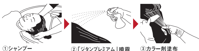
①シャンプー ②「ジタンプレミアム」噴霧 ③カラー剤塗布